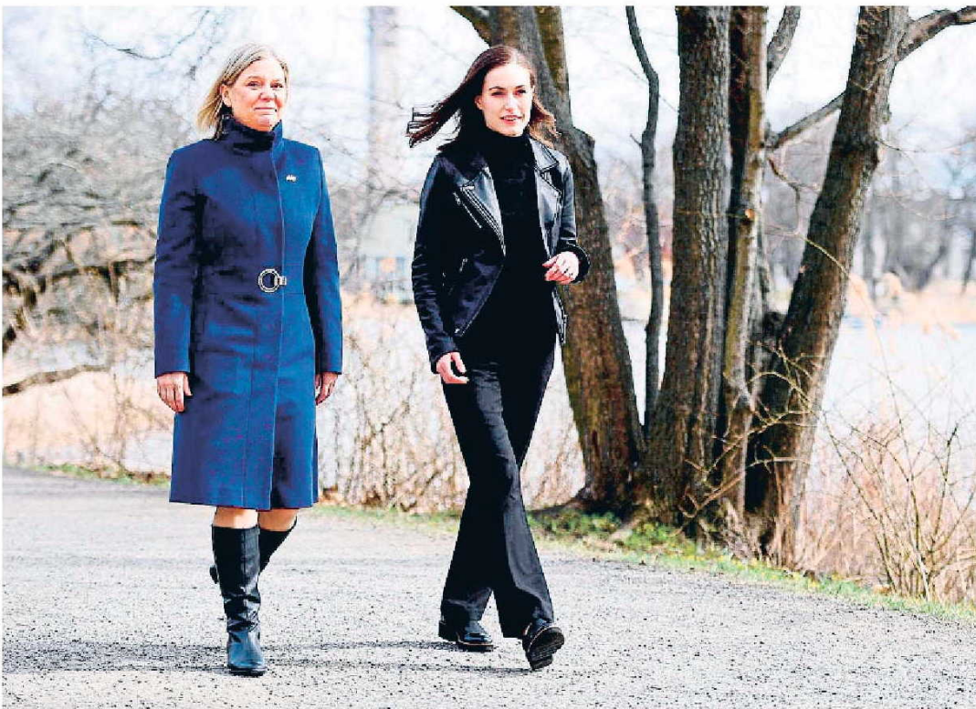
Las primeras ministras de Suecia, Magdalena Andersson, y de Finlandia, Sanna Marin, en su encuentro en Estocolmo el 13 de abril