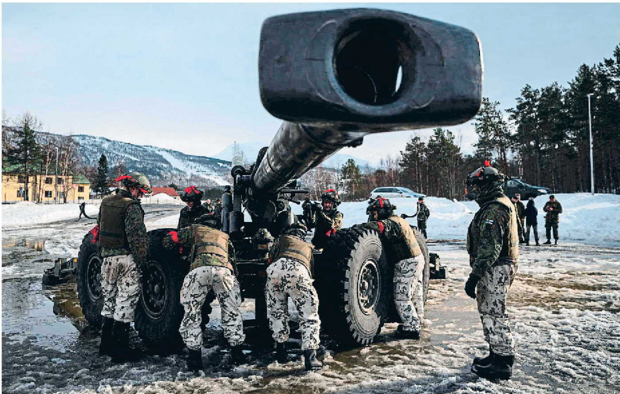
Soldados finlandeses manejan una pieza de artillería en Setermoen (Noruega) el 22 de marzo en unas maniobras de la OTAN; acuden como socios hace años

La invasión rusa de Ucrania precipita el adiós a la neutralidad de los dos países