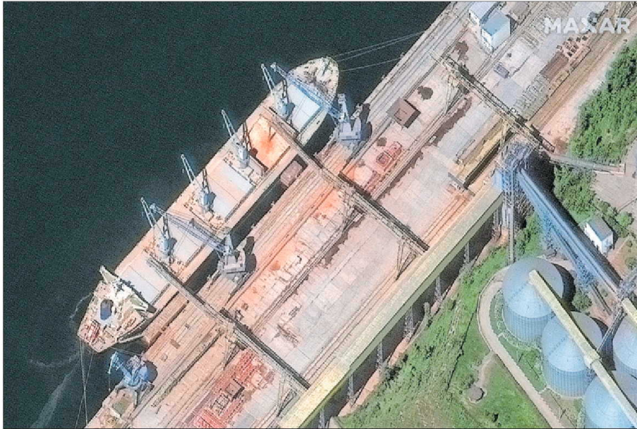
Una imagen de satélite muestra un carguero con cereales el día 19 en el puerto de Sebastopol, en Crimea.