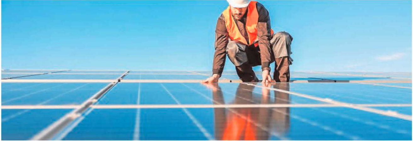
La mayoría de paneles solares, un componente esencial para la transición energética que busca el Gobierno, son importados desde Asia