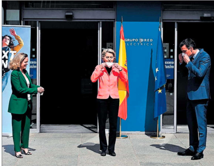
Pedro Sánchez y Nadia Calviño recibían a Ursula von der Leyen el 16 de junio.

En cualquier caso, hay bastantes países que todavía no han gastado nada. Algunos han preferido disponer de más tiempo para elaborar sus planes y no han ido tan rápido como España o Portugal, que fueron los primeros en conseguir el visto bueno de la Comisión para sus planes y que ya han obtenido desembolsos. La idea era que fuese un estímulo para asegurar la recuperación de los efectos