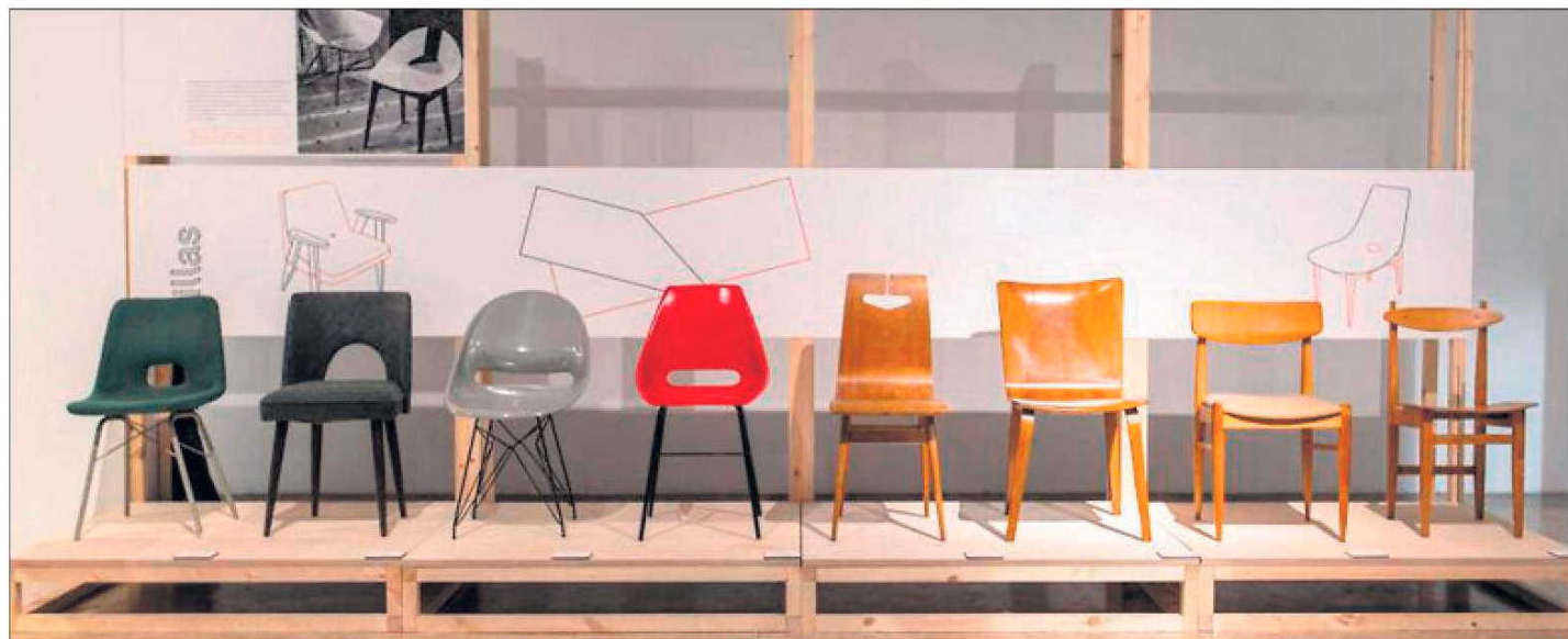
Sillas polacas y checoslovacas de los años cincuenta y sesenta. / INSTITUTO EUROPEO DE DISEÑO (IED)