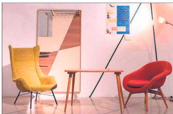
Mobiliario checoslovaco de principios de los sesenta.

Una exposición muestra en Madrid muebles creados tras el telón de acero después de la muerte de Stalin